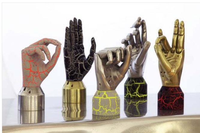
Aleksandra Domanović, Produktionsfotografie von „The Future Was at Her Fingertips“, 2013 Foto: Ulrike Buhl © Aleksandra Domanović