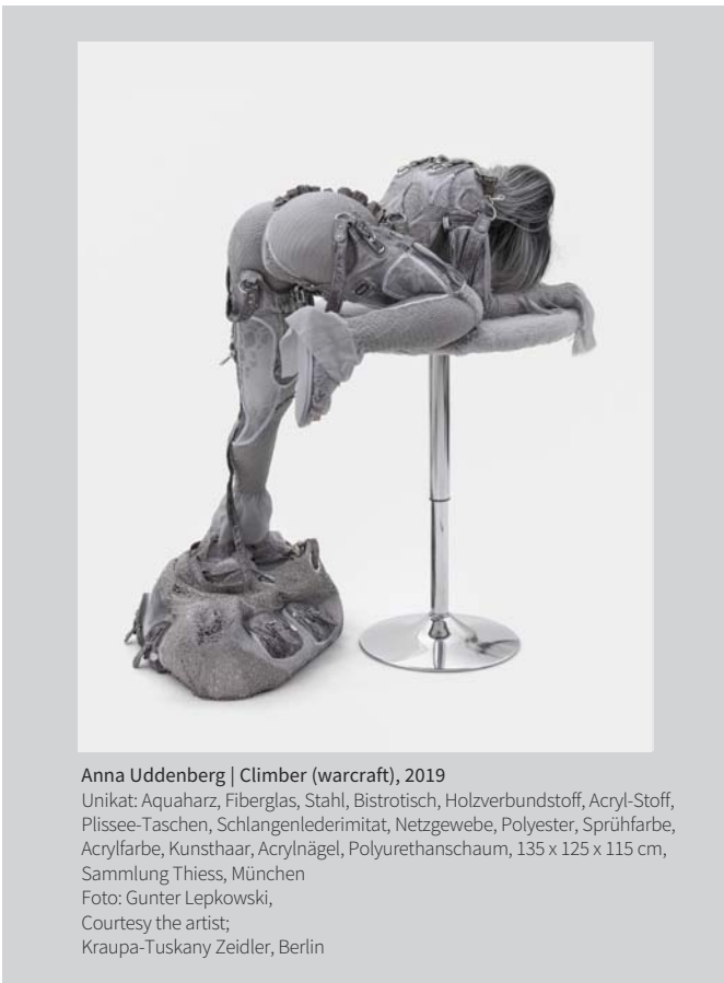
Anna Uddenberg | Climber (warcraft), 2019 Unikat: Aquaharz, Fiberglas, Stahl, Bistrotisch, Holzverbundstoff, Acryl-Stoff, Plissee-Taschen, Schlangenlederimitat, Netzgewebe, Polyester, Sprühfarbe, Acrylfarbe, Kunsthaar, Acrylnägel, Polyurethanschaum, 135 x 125 x 115 cm, Sammlung Thiess, München