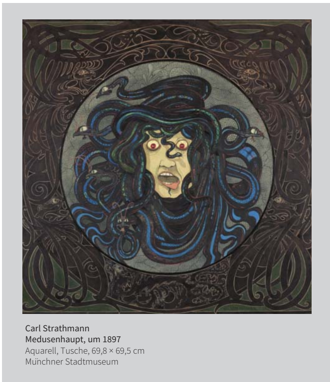
Carl Strathmann Medusenhaupt, um 1897 Aquarell, Tusche, 69,8 × 69,5 cm Münchner Stadtmuseum