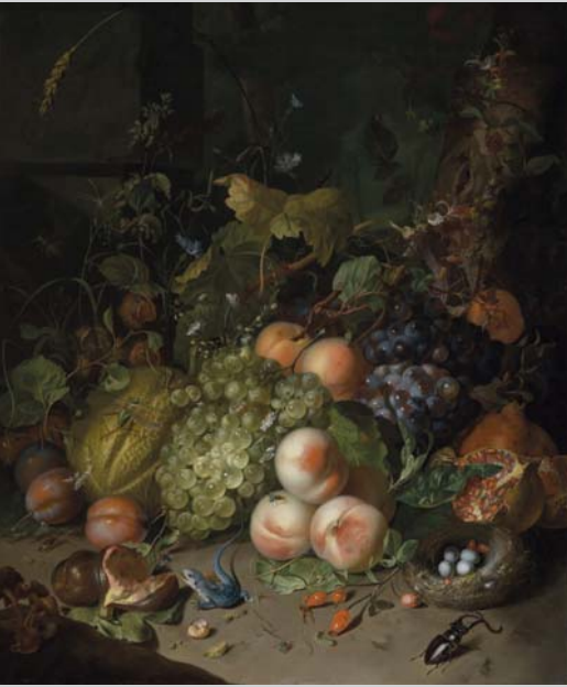
Rachel Ruysch (1664-1750) Fruchtstilleben mit Hirschkäfer und Nest, 1717 Öl auf Leinwand, 65,2 x 54,5 cm, Inventarnummer 377 Staatliche Kunsthalle Karlsruhe